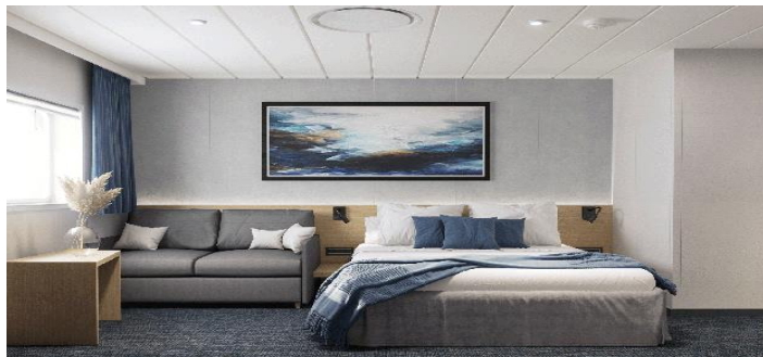
Bild: Beispiel Außenkabine Kat. Meerblick/Seaview

Einzelbelegung: Kat. Meerblick/Seaview, Größe ca. 15 qm: EUR 4.485,-