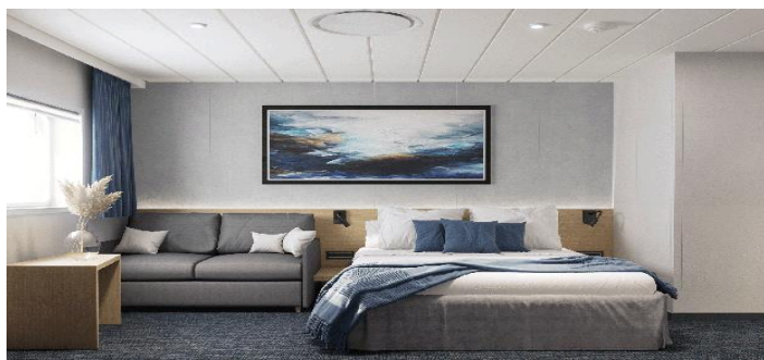
Bild: Beispiel Außenkabine Kat. Meerblick/Seaview

Einzelbelegung: Kat. Meerblick/Seaview, Größe ca. 15 qm: EUR 4.485,-